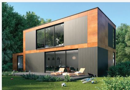
PŁYTY WŁÓKNO-CEMENTOWE SCALAMID