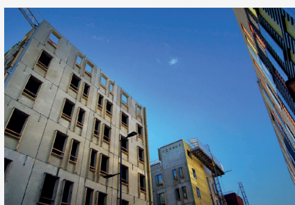
ŚCIANY PREFABRYKOWANE I STROPY FILIGRAN