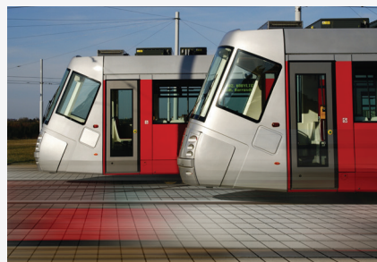
BETONOWE ELEMENTY DROGOWE

Szczegółowe informacje na temat wszystkich produktów dostępne są na stronie: pozbruk.pl/produkty